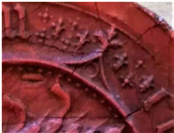
Ryc. 2 Dywizory na XV-wiecznym sekrecie Szczecina. (GStA PK, VIII. HA, I. 9 Slg. Otto Hupp, Kasten I, Heft 13).

Na szczególną uwagę zasługują wykonane z wielkim kunsztem znaki umieszczone w otokach pieczęci Stralsundu [nr 114] i Szczecina [nr 124]. W pierwszym przypadku rytownik rozdzielił słowa legendy wizerunkami smoków lub – jak je widział F. Fabricius – stworzeń ze skrzydłami i ludzkimi twarzami 340 ; zaś w drugim skomplikowanymi ornamentami w formie kropek, lilii i prostokątnych wypustek odstających od linii otokowej wewnętrznej (zob. ryc. 1). Ornamenty pojawiają się na przykład w otokach pieczęci Słupska [nr 106]. Inskrypcję sekretu Szczecina zamyka łeb gryfa.