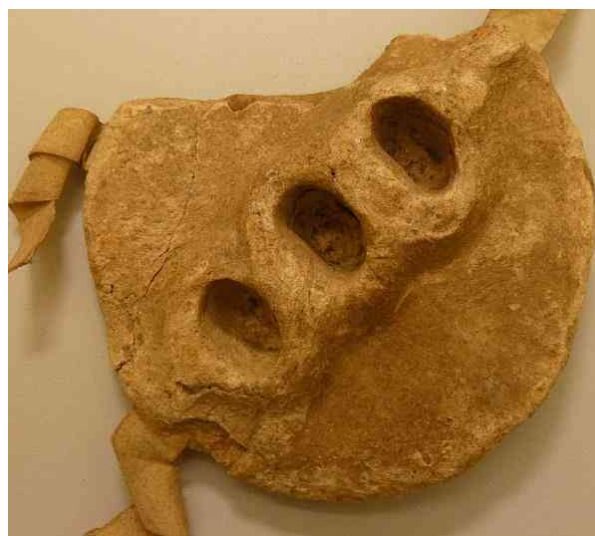
Ryc. 9 Odciski palców na odwrocie pieczęci Greifswaldu przy dokumencie z 1391 r. (LAG, Rep. 38 bU Demmin nr 93).