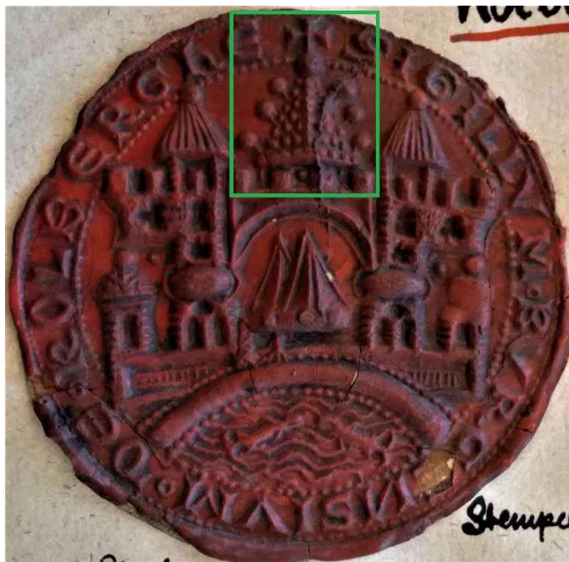
Ryc. 5 XIII-wieczna pieczęć Kolobrzegu. Na zielono zaznaczono wieżę zwieńczoną hełmem (GStA PK, VIII. HA, I. 9 Slg. Otto Hupp, Kasten I, Heft 14).

Mury miejskie zwieńczone blankami, bez dachu, ale za to z basztami i przejazdami/bramami widzimy na pieczęciach Dąbia [nr 28; 29] i Demminu [nr 30, 31, 32]. Znow w tych przypadkach literatura niekiedy interpretuje te budowle jako zamki 426 . Istotnie, w pobliżu obu miast istniały zamki książęce (Haus Demmin zamieszkały był przez księcia Warcisława III do 1264 r.) 427 . Wątpliwe jednak, by miasta, które dość wcześniej rozpoczęły budowę murów miejskich 428 , umieściły na swoich pieczęciach wizerunki warowni książęcych,