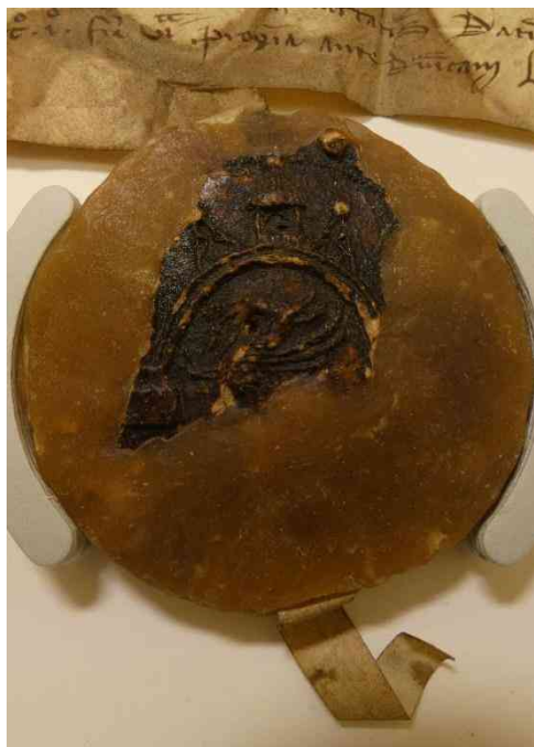
Ryc. 8 Pieczęć Wolina mocowana na tzw. języczek do dokumentu z 1301 r. (LAG, Rep. 2 Anklam nr 4).