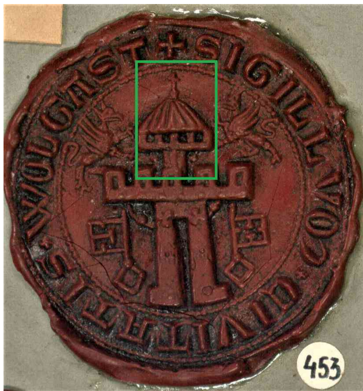
Ryc. 6 XIII-wieczna pieczęć Wolgast. Na zielono zaznaczono przypuszczalną wieżę kościoła (APSz, Zbiór pieczęci i tłoków pieczętnych, Kopie Trójwymiarowe - Reprodukcje, sygn. 2, nr 453).

Pieczenie dwóch miast Księstwa Rugijskiego – Garz (Rügen) i Tribsees, o których podobieństwie już wspomniano – przedstawiają architekturę obronną o bardzo podobnym układzie. Pierścień murów, w którym umieszczono bramę/przejazd, otacza trzy wieże, z których środkową (szerszą) wieńczą blanki, boczne (węższe) nakryte są dachami spadzistymi. Wyraźne umieszczenie wież za linią murów wskazuje, że nie mamy tu do czynienia z fragmentem fortyfikacji (samą bramą), lecz z całym zabudowanym obszarem. Być może są to przedstawienia całego miasta?