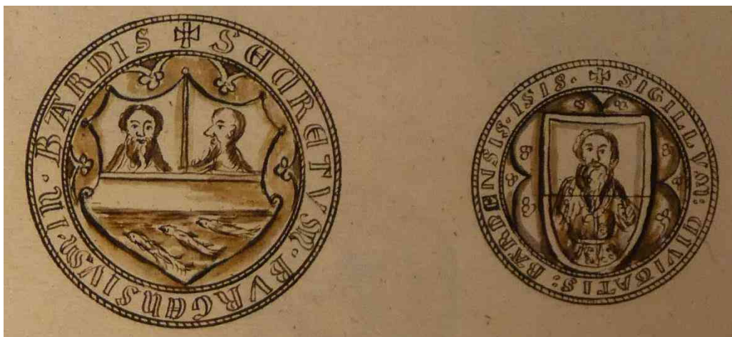
Ryc. 1. Rysunki rzekomych pieczęci Barth ze zbioru J. K. K. Oelrichsa.

Oczywiście bezsprzecznie wiarygodne są te odrisy, które przedstawiają pieczęć znaną z reprodukcji lakowych, czy oryginalnych odcisków, nawet jeśli są obarczone niewielkim błędem w pomiarze średnicy, czy drobną różnicą w zapisie legendy otokowej. W przypadku rysunków nieznanymi nam skądinąd pieczęci, musimy zachować szczególną ostrożność. Z całą pewnością należy odrzucić te, które zawierają błędy formalne, takie jak niedopasowanie stylistyczne inskrypcji napieczętej i wizerunku w polu pieczęci. Przykładem tego mogą być rysunki domniemanych pieczęci miasta Barth stworzone przez Johanna K. K. Oelrichsa, na których widzimy inskrypcję zapisaną majuskułą gotycką (wskazującą na XIII-XIV wiek) połączoną z renesansową tarczą gotycką lub z zapisem legendy wskazującym na rok 1518, jako na datę wytworzenia tłoka (zob. ryc. 1).