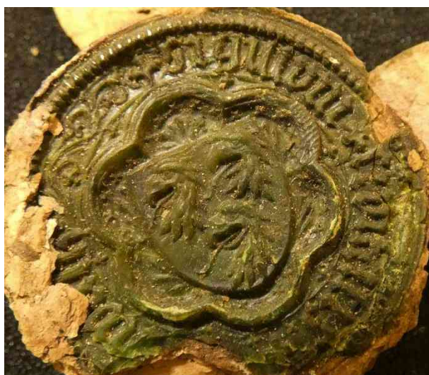
Ryc. 3 Pieczęć Pasewalku z bordiurą w formie wielołuku (1509 r.). (LAG Rep. 38 bU Köslin nr 182).

zdobieniami. Ozdobne bordiury w formie wielołuku, najczęściej z sześcioma płatkami pojawiają się już w XIV wieku na pieczęciach mniejszych i na contrasigillum Stralsundu [nr 116; 119]. W XVI wieku w kancelarii tego miasta pojawiała się jeszcze jedna pieczęć mniejsza z takim motywem [nr 118]. Wspomnianą pieczęć odwrocia, poza bordiurą, zdobi także ornament roślinny (liście) wypełniający pole pieczęci. Takie same ozdoby – bordiurę i liście – możemy znaleźć na odcisku Pasewalku przywieszonym do dokumentu z 1509 roku (zob. ryc. 3) 342 . Zastosowana na pieczęci minuskuła gotycka wskazuje, że miasto mogło wprowadzić ją do użycia już w XV wieku. Być może Pasewalk wzorował się na stylistyce sigillów stralsundzkich.